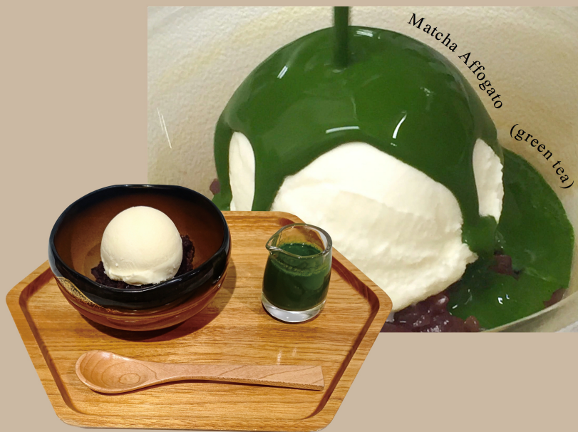
Matcha Afogato (green tea)

宇治抹茶「金天閣」を 「スノーロイヤル」バニラアイスクリームの上 からかけてお召し上がりください。