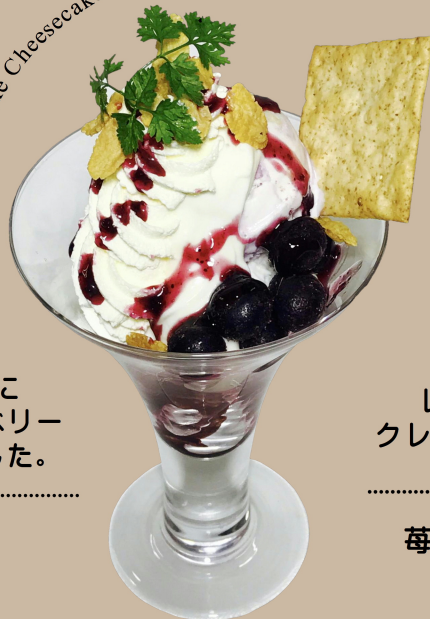
No-bake Cheesecake Parfait

クリームチーズアイスと ブルーベリーチーズアイスに レアチーズとたっぷりブルーベリー ソースで甘酸っぱく仕上げました。