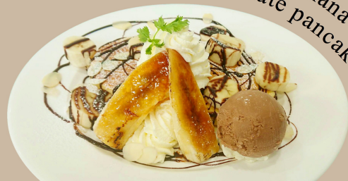
Browned banana and chocolate pancake

チョコレートソースとバナナをたっぷりと使い、こんがりとキャラメリゼしたバナナとチョコレートアイスで濃厚に仕上げました。