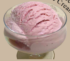
ストロベリーアイス