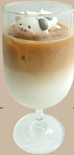
Chewy coffee milk