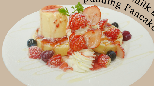
Strawberry milk and pudding Pancake