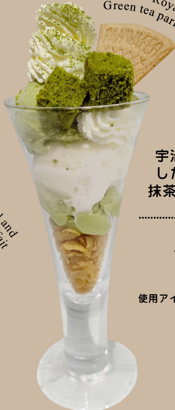
Snow Royal Green tea parfait