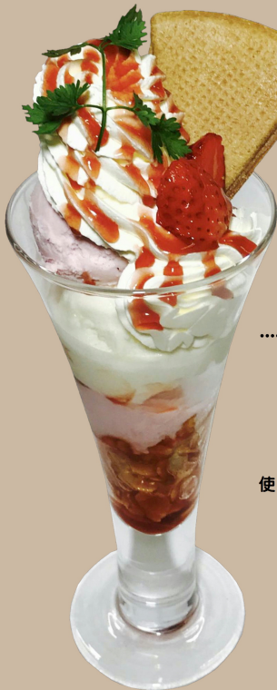
Snow Royal and Strawberry Parfait