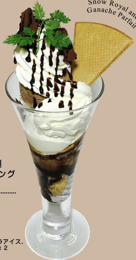
Snow Royal and Ganache Parfait