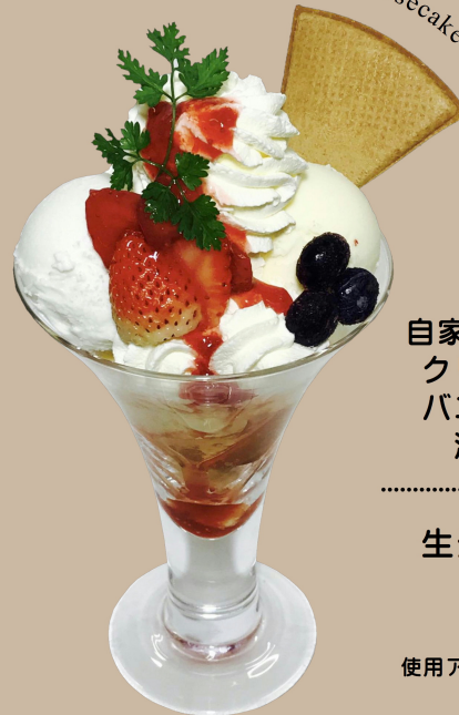
Fresh Cheesecake Parfait

自家製の生チーズケーキに クリームチーズアイスと バニラアイスを合わせた 濃厚チーズパフェ。