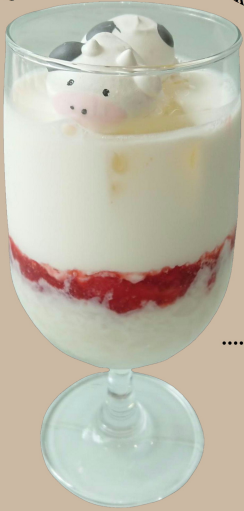
Chewy strawberry milk