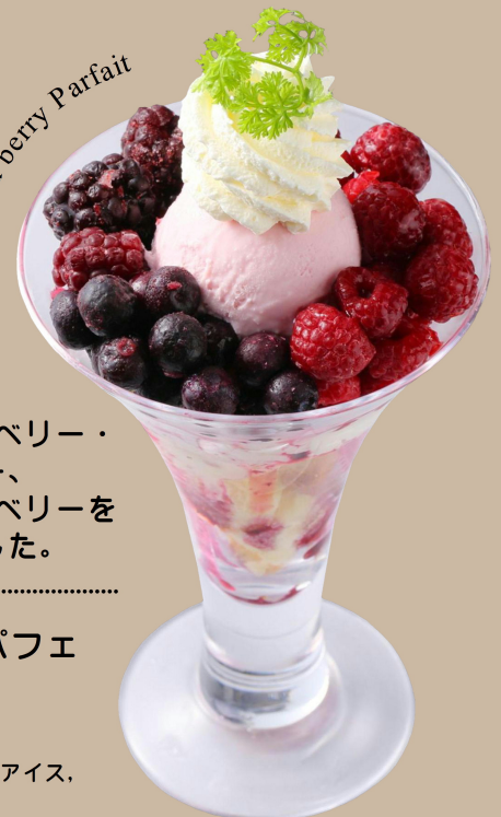
Mixed berry Parfait

ブルーベリー・ラズベリー・ ブラックベリー、 3種類のフローズンベリーを トッピングしました。