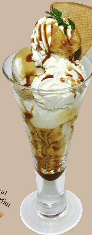
Snow Royal and Creamy Caramel Parfait

スイートなキャラメルアイスに やさしい口どけの生キャラメル をトッピングしました。