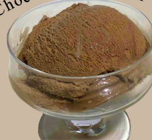
チョコレートアイス