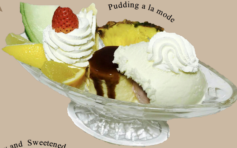
Pudding a la mode