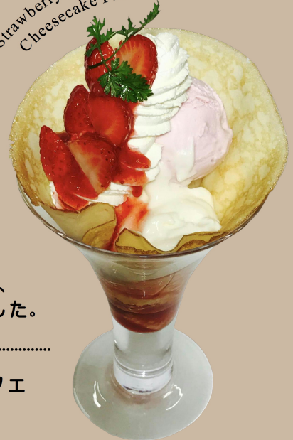
Strawberry and No-bake Cheesecake Parfait