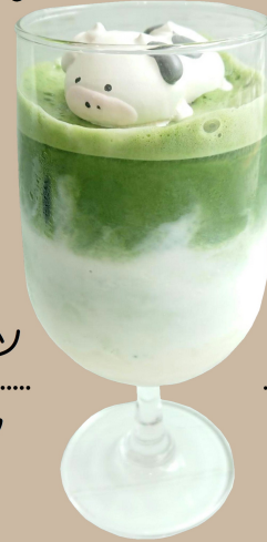
Chewy Matcha milk