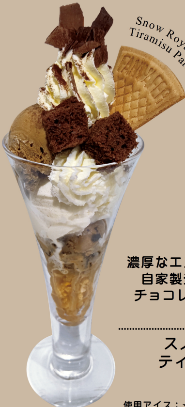
Snow Royal and Tiramisu Parfait

濃厚なエスプレッソアイスに 自家製チョコシフォン、 チョコレートをトッピング しました。