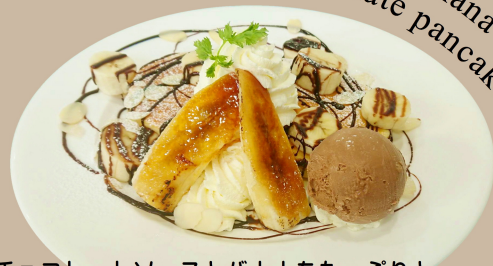
Browned banana and chocolate pancake

チョコレートソースとバナナをたっぷりと。こんがりとキャラメリゼしたバナナとチョコレートアイスで濃厚に仕上げました。