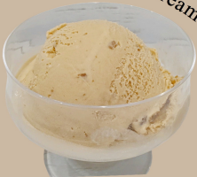
イタリアンマロン アイス