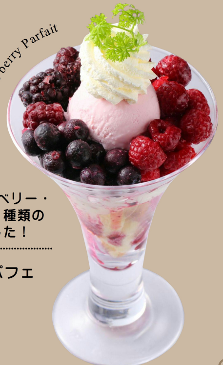
Mixed berry Parfait