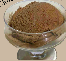
チョコレートアイス