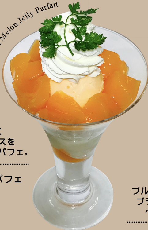
Yubari Melon Jelly Parfait