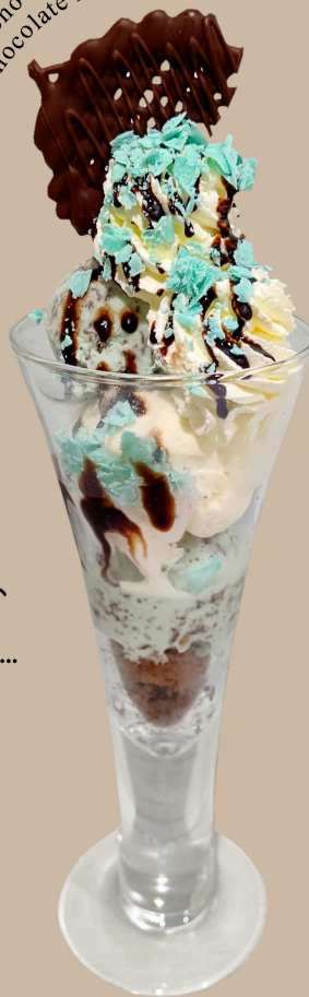
Snow Royal and Chocolate mint Parfait

チョコチップミントアイスに 「スノーロイヤル」を合わせ、 ミントのチョコレートを トッピング。 チョコミントづくしの 爽やかな味わいです。