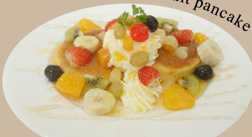
Honey and fruit pancake

マンゴー、バナナ、苺、キウイなどたっぷりのフルーツに、はちみつでキラキラ甘くさわやかに仕上げました。