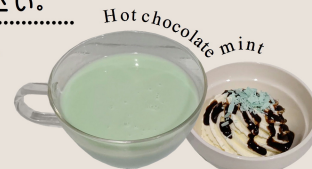
Hot chocolate mint