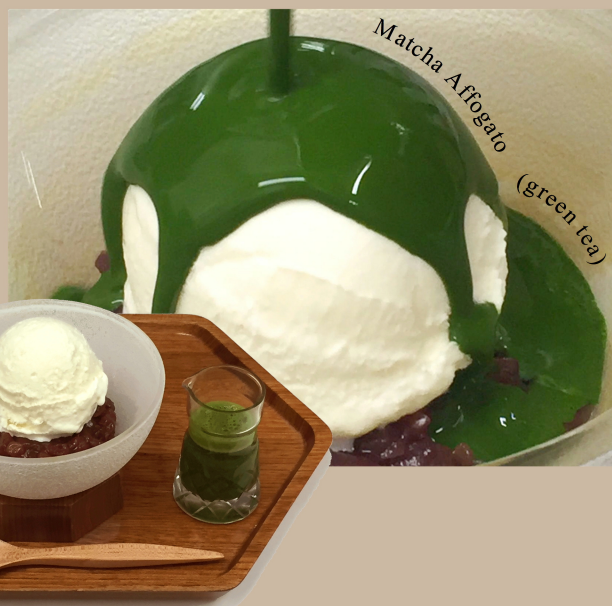
Matcha Afogato (green tea)

宇治抹茶「金天閣」を 「スノーロイヤル」バニラアイスクリームの 上からかけてお召し上がりください。