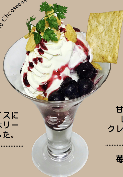
No-bake Cheesecake Parfait

クリームチーズアイスと ブルーベリーチーズケーキアイスに レアチーズとたっぷりブルーベリー ソースで甘酸っぱく仕上げました。