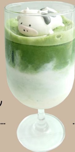
宇治抹茶「金天閣」 もちもち抹茶ミルク