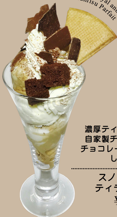
Snow Royal and Tiramisu Parfait

濃厚ティラミスアイスに 自家製チョコシフォン、 チョコレートをトッピング しました。