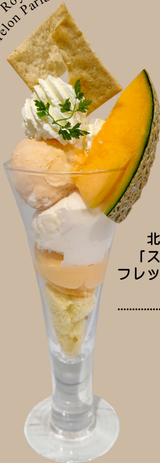
Snow Royal and Melon Parfait

北海道メロンジェラートに 「スノーロイヤル」を合わせ、 フレッシュな赤肉メロンを添えた、 贅沢な味わいです。