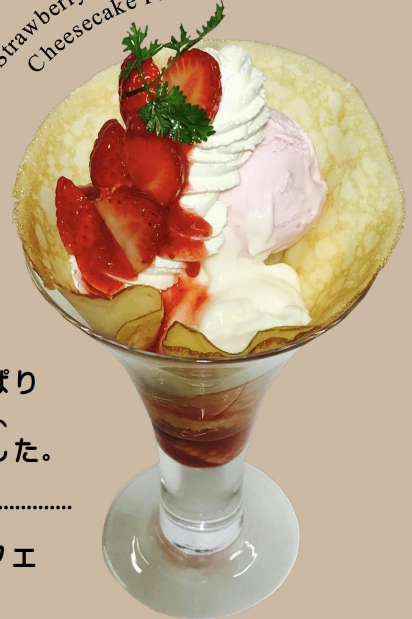
Strawberry and No-bake Cheesecake Parfait