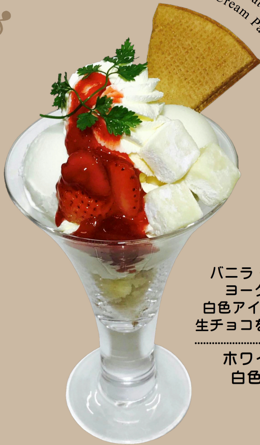
White Chocolate of White Ice Cream Parfait

バニラ・クリームチーズ・ ヨーグルトの3種類の 白色アイスに自家製ホワイト 生チョコを贅沢にトッピング。