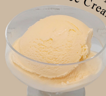
北海道メロンアイス