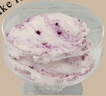
ブルーベリーチーズ ケーキアイス