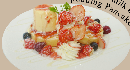
Strawberry milk and pudding Pancake