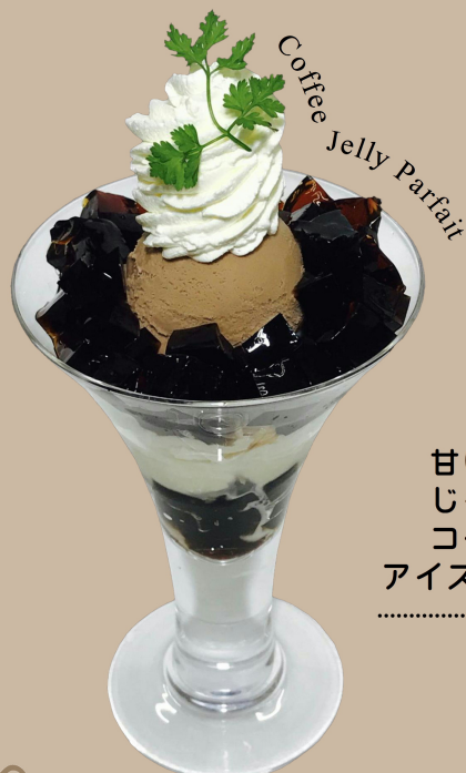
Coffee Jelly Parfait

甘いものがそんなに得意 じゃない方におすすめ！ コーヒーゼリーの苦みと アイスの甘さがベストマッチ！