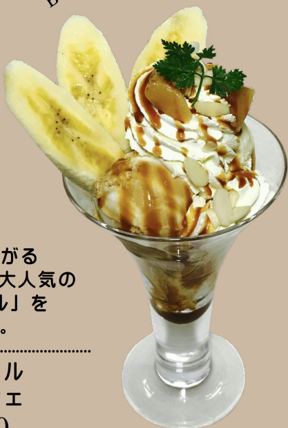
Creamy Caramel and Banana Parfait

お口の中に広がる やさしい口どけ...大人気の 「生キャラメル」を トッピング。