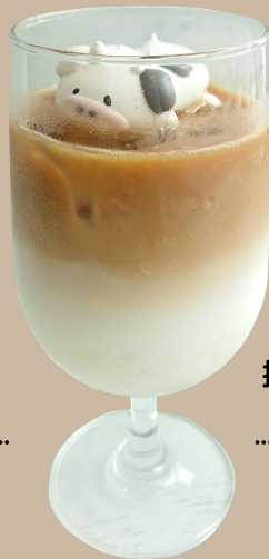
挽きたてエスプレッソ もちもち珈琲ミルク