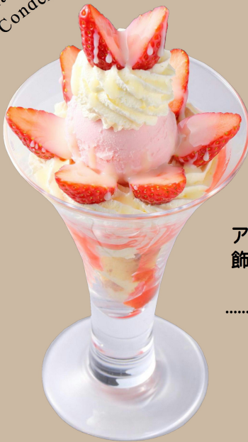
Strawberry and Sweetened Condensed Milk Parfait

バニラとストロベリーの アイスに甘酢っぱいいちごを 飾り付け、たっぷりの練乳を かけた人気のパフェ。