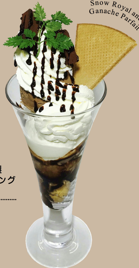
Snow Royal and Ganache Parfait