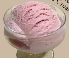
ストロベリーアイス