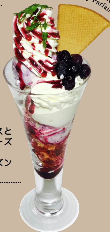
Snow Royal and Blueberry Parfait

果肉入りのブルーベリーソースと クッキーを混ぜ込んだレアチーズ ケーキのような味わいの ブルーベリーアイスにフローズン ブルーベリーを添えました。