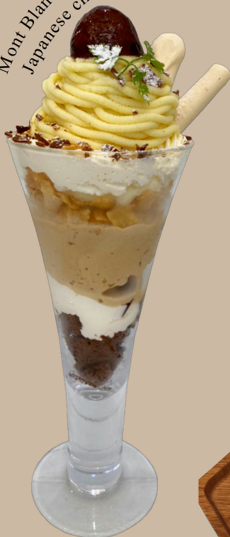
Mont Blanc Parfait of Japanese chestnut

Please select a "Vanilla ice cream" or "Green tea ice cream".