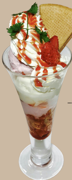
Snow Royal and Strawberry Parfait