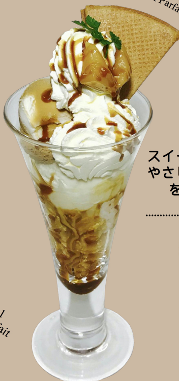
Snow Royal and Creamy Caramel Parfait

スイートなキャラメルアイスに やさしい口どけの生キャラメル をトッピングしました。