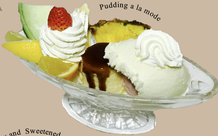
Pudding a la mode