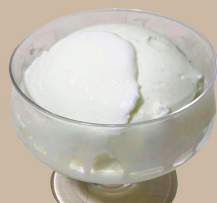
北海道クリーム チーズ