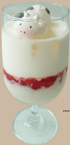
莓果肉入 もちもち苺ミルク

※ うしはメレンゲで出来ています。ひとつひとつ手作りの為、顔がそれぞれ違います。