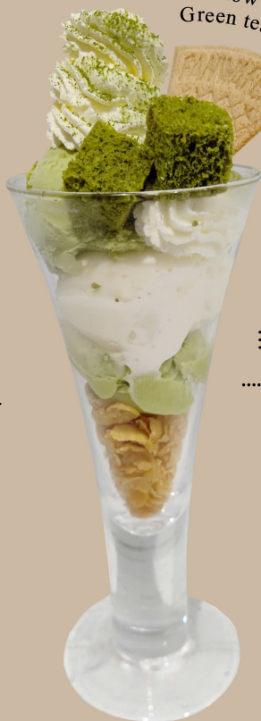
Snow Royal Green tea parfait