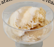
キャラメルラテ アイス