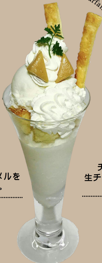
Snow Royal Parfait

スノーロイヤルを ふんだんに使用し、 口溶けの良い生キャラメルを トッピングしました。