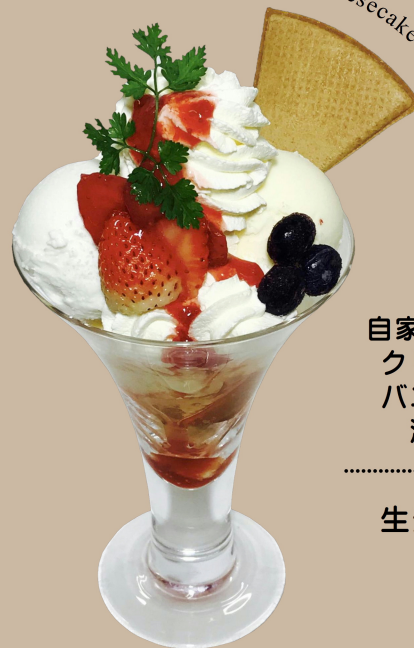
Fresh Cheesecake Parfait

自家製の生チーズケーキに クリームチーズアイスと バニラアイスを含ませた 濃厚チーズパフェ。